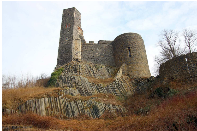
Steinbruch unterhalb der Burg Stolpen, mit nach oben zusammenlaufenden Basaltsäulen

Basierend auf eine Spezialkartierung der letzten 20 Jahre und modernen Erkenntnissen zur Vulkanologie ist eine neue Rekonstruktion zur Entstehung des Stolpen-Vulkans möglich. Diese Ergebnisse sowie die Bedeutung Stolpens als internationale Typlokalität für das Gestein ‚Basalt‘ werden in einem Vortrag, einer speziellen Mikroskopie-Präsentation und einer geologischen Führung über den Burgberg Stolpen vorgestellt.