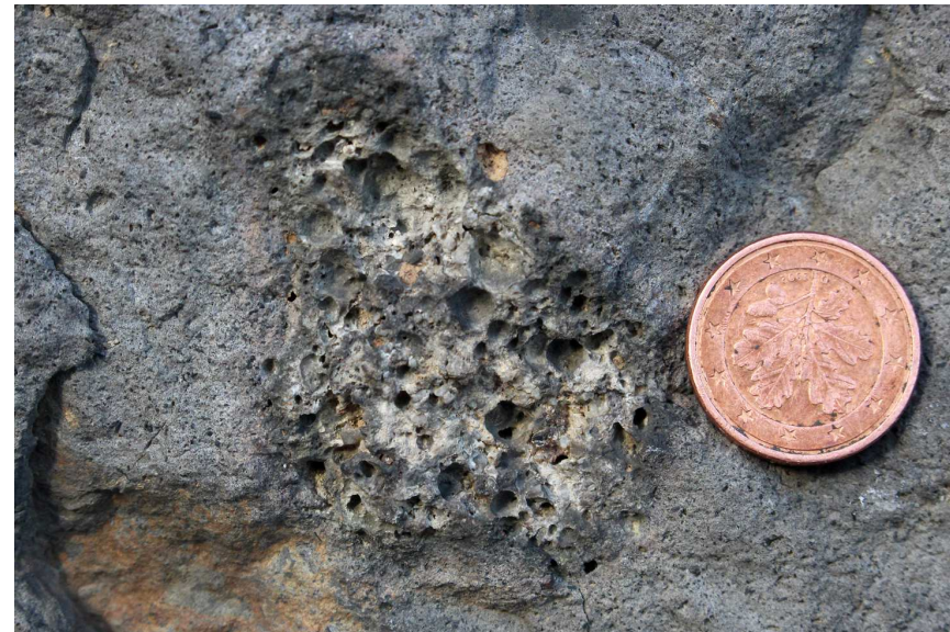
Einschluß einer Basaltschlacke in der basaltischen Stolpenlava als Hinweis auf einen Schlackenkegelvulkan